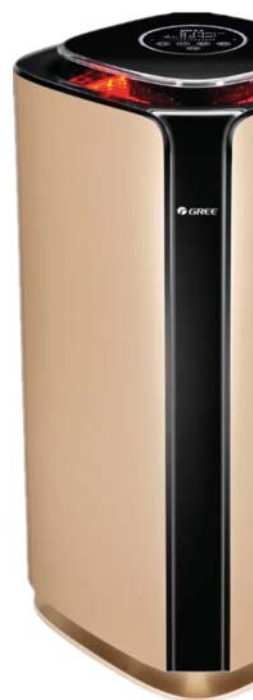
Замърсен въздух PM = 2.5>115