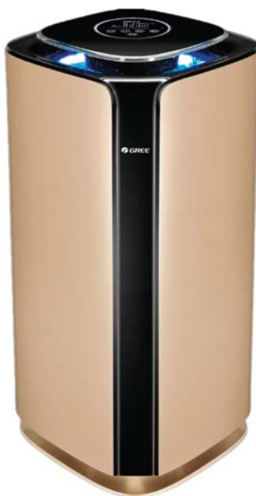
Нормален въздух PM = 2.5:36~115