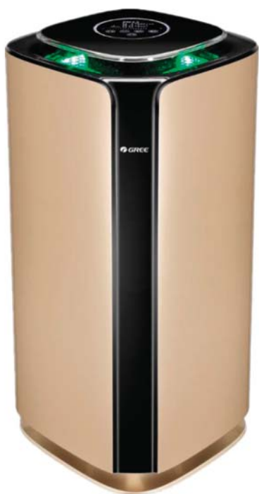
Пресен въздух PM = 2.5<35

3 цвята за 3 различни стойности на качеството на въздуха